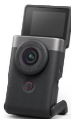
PowerShot V10 (Vlog カメラ)